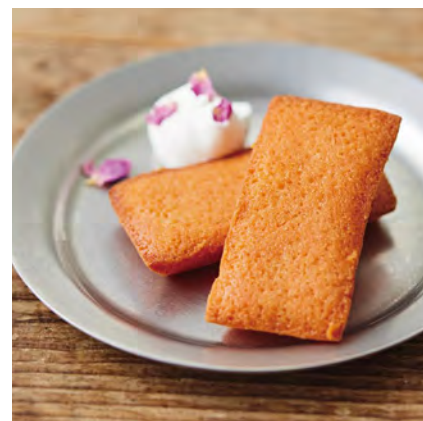
ローズフィナンシェ ¥600

高知県のハーブ農家さんから届くさっくり食感のクッキー。スペアミントとローズマリー2種類の香りをお楽しみいただけます。