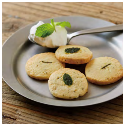
香るハーブクッキー ¥600

外はカリッと中はふわトロ、自慢のフレンチトースト。ご注文をいただいてから、じっくり焼き上げます。季節のフルーツとホイップクリームをお好みでお使いください。