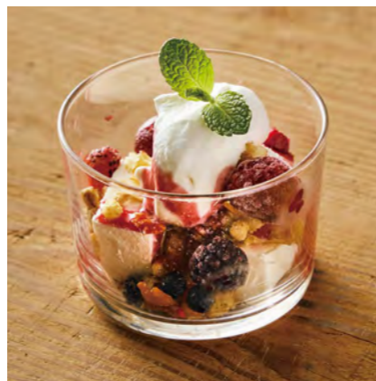
レアチーズトライフル ¥600

ヘルシーな上に美容効果もあると言われるダマスクローズの香り、エキスを豊富に使用。