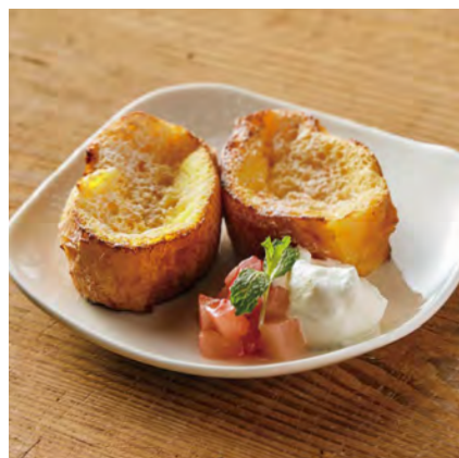
自家製フレンチトースト ¥600