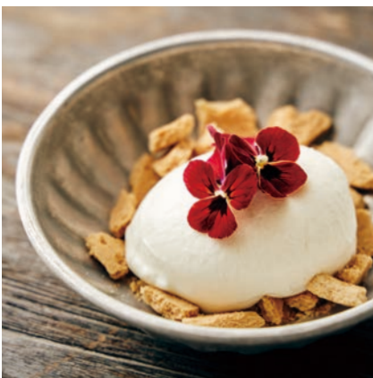
花摘みレアチーズ

ヘルシーな上に美容効果もあると言われるダマスクローズの香り、エキスを豊富に使用。