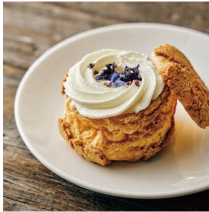
フラワークリームパフ

クッキーシューの中にハニーミルククリームと生クリーム。優しいお花の香りと一緒に。