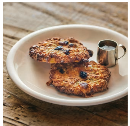
オートミールクッキー

高知県のハーブ農家さんから届くさっくり食感のクッキー。スペアミントとローズマリー2種類の香りをお楽しみいただけます。