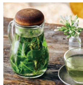
紅茶・ハーブティー