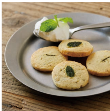
香るハーブクッキー

濃厚でとろける食感のレアチーズ、ケーキの中からはバラの花弁たっぷりのコンフィチュール。