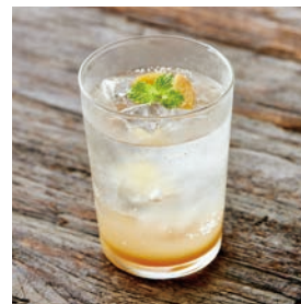
自家製ジンジャーエール