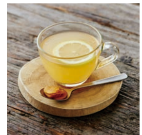
ホットジンジャー